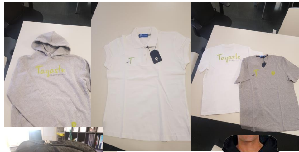
SOPORTES DE COMUNICACIÓN IMPRESOS. PRINTED COMMUNICATION MEDIA